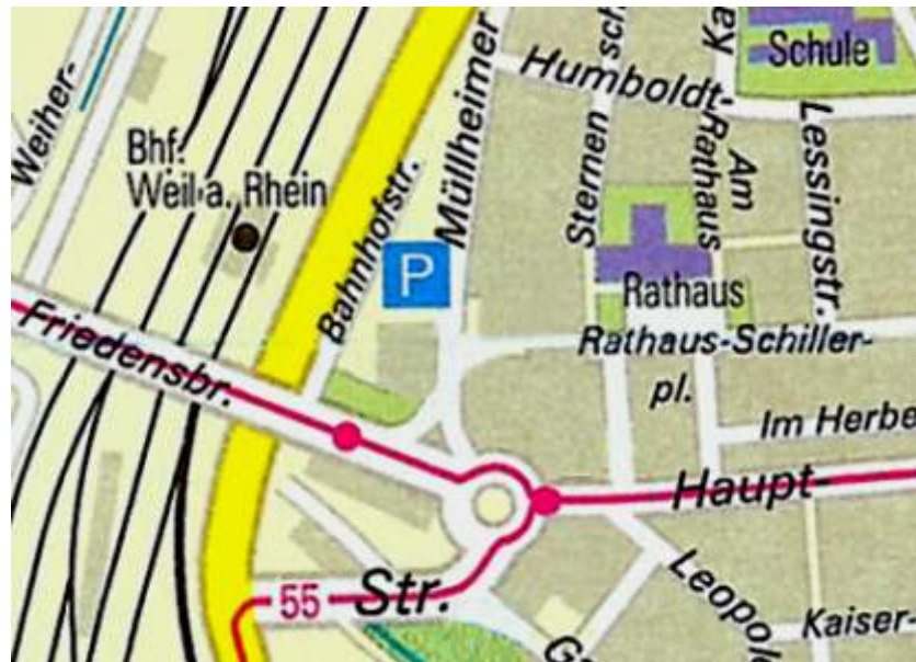
Weil am Rhein: Zentrum mit Rathaus (Rathausplatz 1), Bahnhof und Parkplatz "Hangkante"