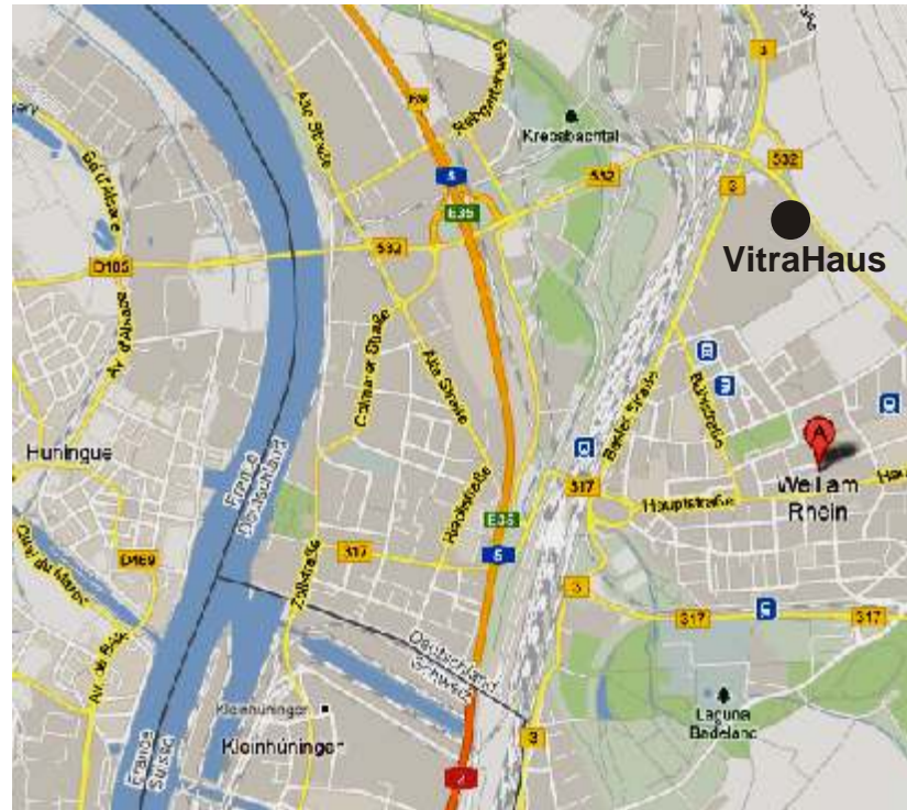
Weil am Rhein: Geografische Lage mit Anfahrtswegen und "VitraHaus" (Vitra Campus, Charles-Eames-Strasse 2)