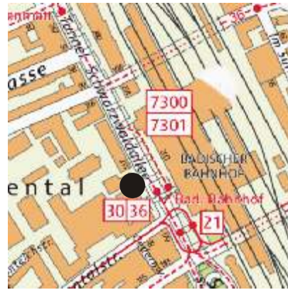
Extrabusse ab Basel Badischer Bahnhof, Schwarzwaldallee (gegenüber Bahnhofsgebäude)