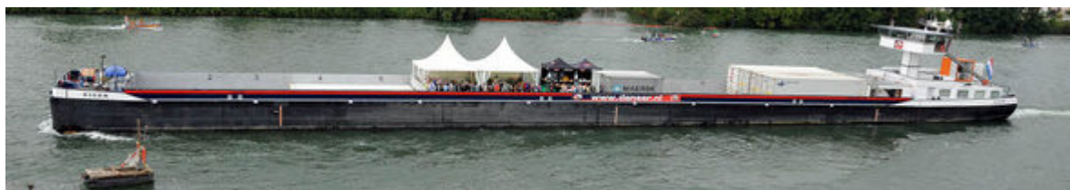
„Beiz“ an Bord: Selbst lange Lastkähne, die üblicherweise bloß Güter transportieren, wurden fürs Fest mit einer Schenke versehen.

Den Menschen den Hafen näher bringen und seine Bedeutung als größte Logistikdrehscheibe der Schweiz bekannt machen: Das wollten die Schweizerischen Rheinhäfen und ihre Partner mit dem dreitägigen Fest im Stadthafen Kleinhüningen. Gelungen ist ihnen das bestens: Laut Veranstalter kamen rund 100 000 Besucher, um sich unterhalten zu lassen, aber auch um sich zu informieren.