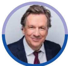
Jörg Kachelmann, Meteorologe

Wir bitten, wegen begrenzter Plätze um verbindliche Anmeldung bis zum 21. März 2025 unter info@regiotrirhena.org oder www.regiotrirhena.org/events