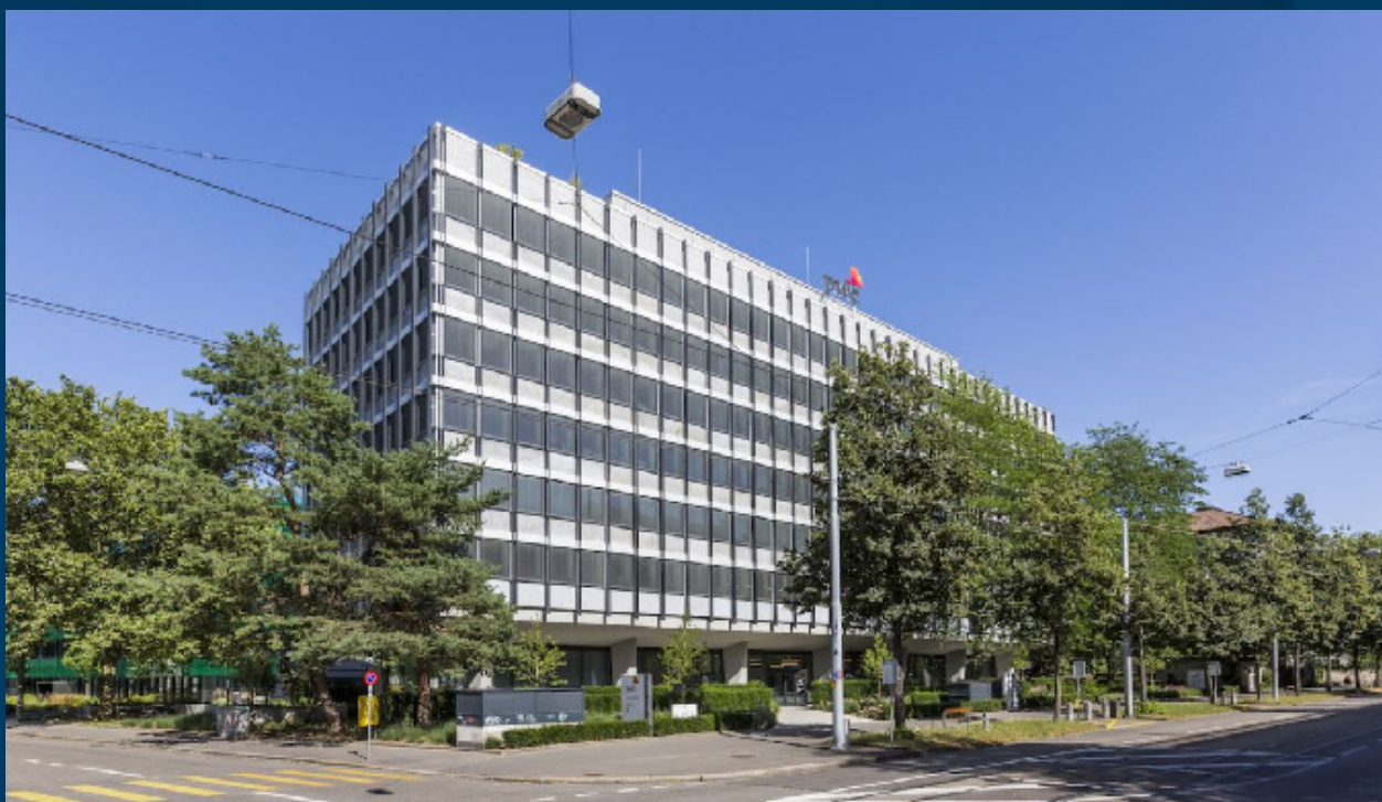
Handelskammer Beider Basel

Drachencenter : Henric Petri-Strasse 11, 4051 Basel Anfos : Henric Petri-Strasse 21, 4051 Basel