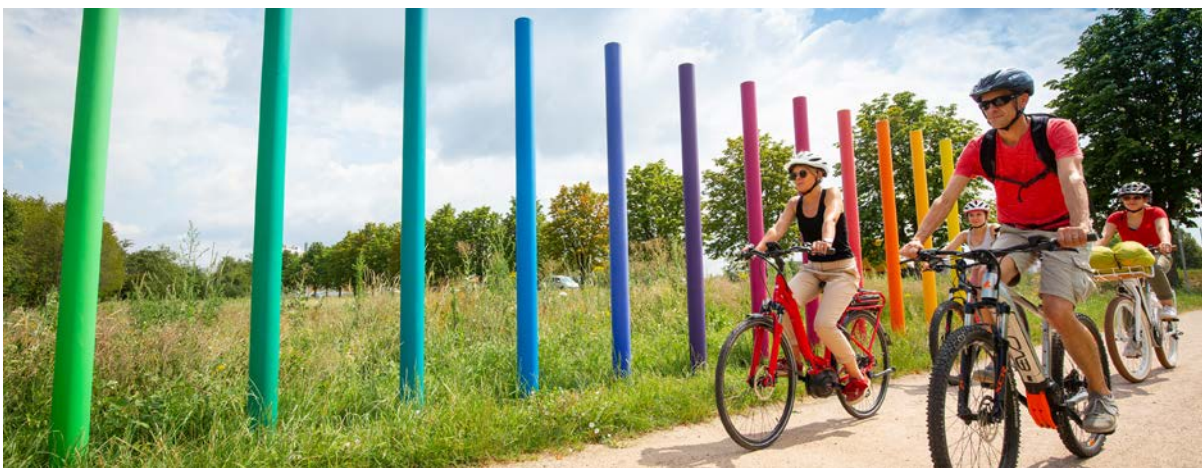
Cyclistes sur la grande boucle des trois pays (Projet Interreg V porté par l'ETB)

En principe, les projets sont portés par des membres de l'ETB. Lorsqu'aucun porteur de projet ne peut être trouvé, ces projets peuvent être confiés à l'ETB dès lors que cela correspond à un besoin trinational.