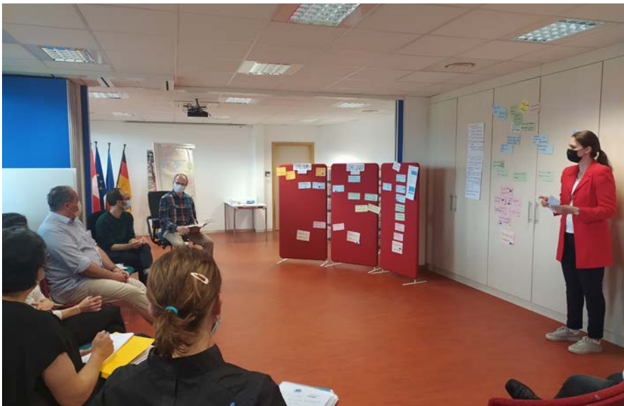
Echange entre experts de l'aménagement lors d'un workshop du 3Land, juin 2021

L'ETB assure d'une manière coordonnée et trinationale la représentation de la région et de ses intérêts au niveau régional, national et européen.