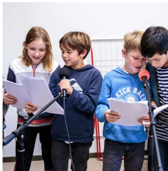
Microprojet Interreg Wanderhörspiel