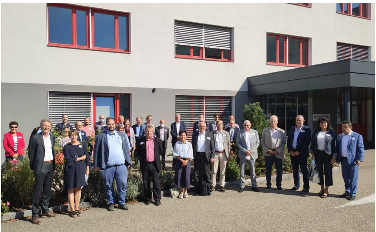
Journée des délégués 2021, avec les membres de l'ETB, Visite de Jet Aviation

Les membres sont régulièrement impliqués dans les activités de l'ETB et contribuent aux travaux politiques et aux projets de l'ETB.