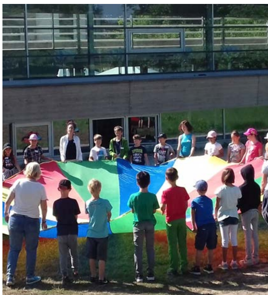
Projet du fonds de rencontre scolaire

L'ETB contribue au soutien du plurilinguisme au sein de la population, afin d'améliorer les conditions pour l'échange et les rencontres trinationaux. Il participe ainsi à faciliter l'accès au marché de l'emploi transfrontalier dans le pays voisin.