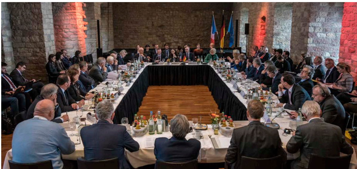
Réunion du comité franco-allemand pour la coopération transfrontalière en 2019, à Hambach (D)

L'ETB, grâce au dialogue entre les acteurs représentés au sein du Comité pour la coopération transfrontalière, concourt à l'identification et à la résolution des obstacles liés à la coopération transfrontalière.