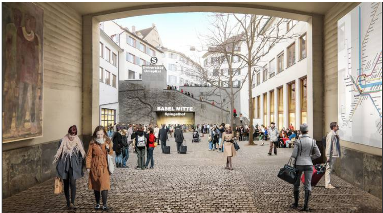
Visualisierung Haltestelle Mitte, Ausgang Uni / Unispital