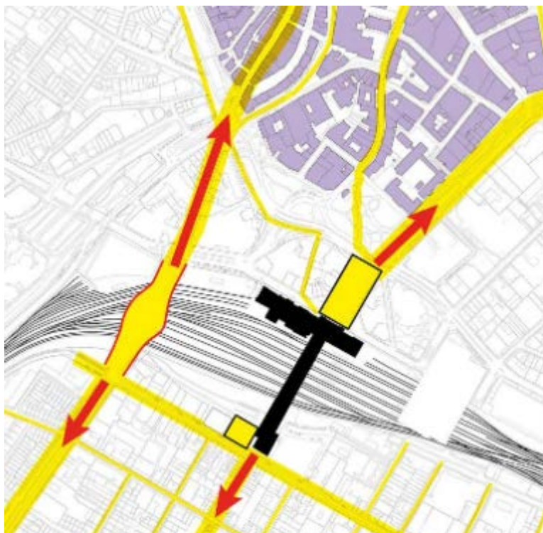
Die Margarethenbrücke soll beim Margarethenplatz verbreitert werden.