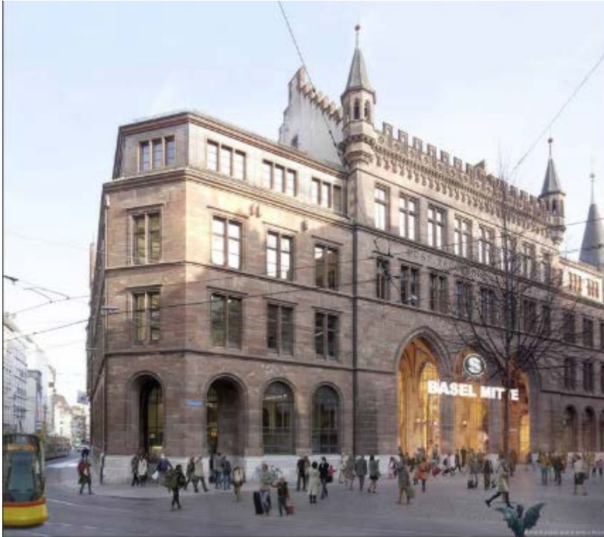
Visualisierung Haltestelle Mitte, Ausgang Hauptpost / © Herzog de Meuron