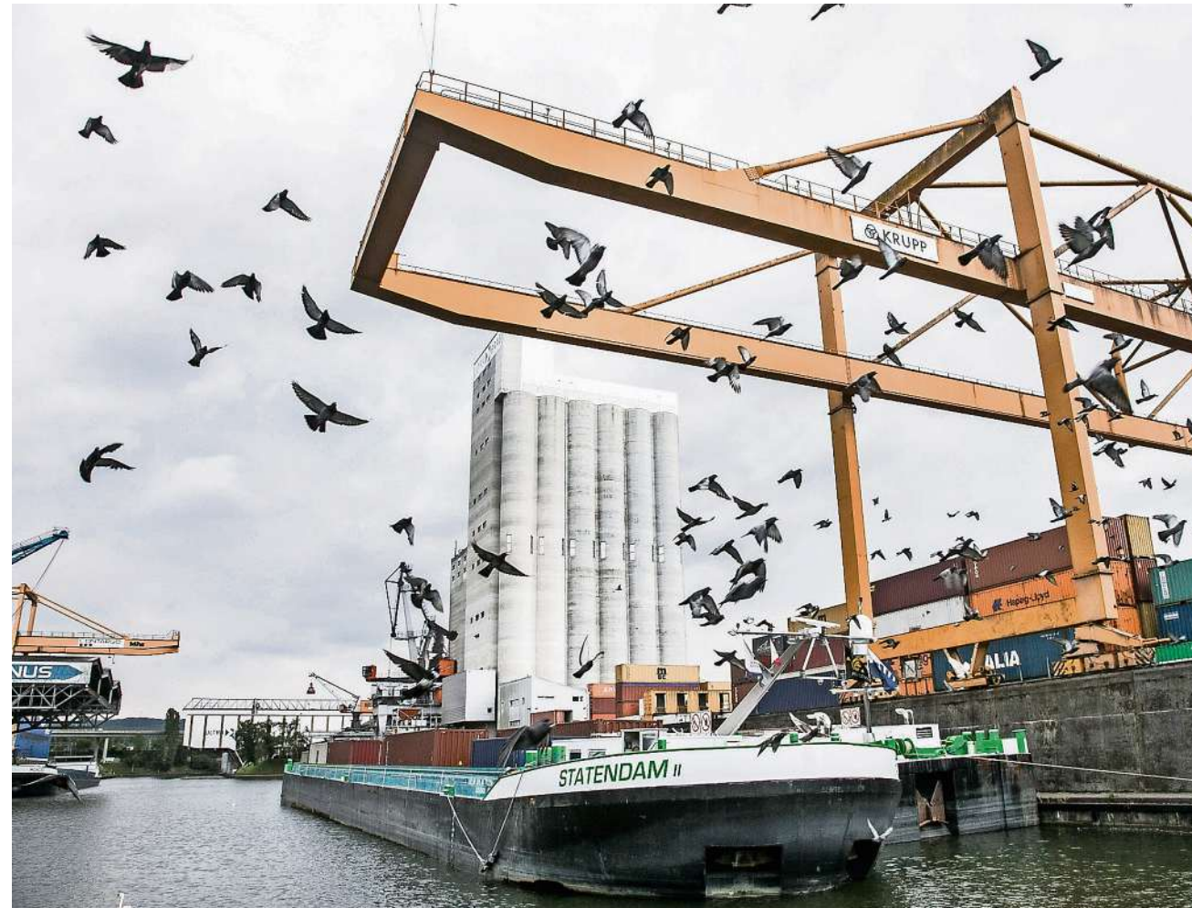
Noch spielt der Wettbewerb. Im Güterumschlag auf dem Wasser droht in Basel eine Monopolsituation.