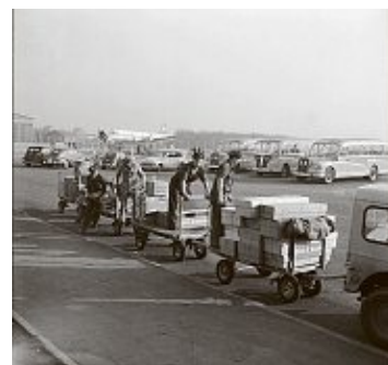
Einblicke in den Alltag von 1953: Ein Gepäcktransfer am Flughafen.