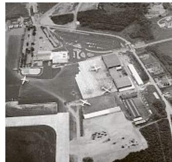
Vier grosse Flugzeuge auf dem Rollfeld: So klein war der Euro-Airport 1959.

Im Januar 2002 war es so weit: Der Name Crossair war