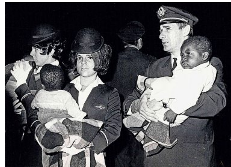
1971 kamen 80 geflüchtete Frauen und Kinder aus der Republik Biafra am Flughafen in Basel an.

Geschichte. Die Flugzeuge zeigten sich in neuem Gewand. Ein Airbus in Basel präsentierte das neue Swiss-Logo.