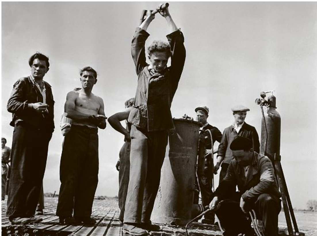
1946: Im April fanden die letzten Arbeiten statt: Die Start- und Landebahn wurden verlegt. Im Mai wurde der Flughafen Basel-Mulhouse dann schliesslich eröffnet.

Derweil stiegen die Passagierzahlen. Im Jahr 1956 wurden erstmals 100'000 Passagiere in einem Jahr verzeichnet. Das Wachstum ging in den folgenden 80 Jahren weiter: Im Jahr 2025 belief sich das Passagieraufkommen auf 9,6 Millionen Personen.