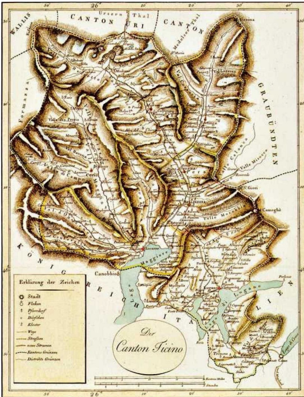
La carte du Tessin publiée en 1812 montre un canton politiquement uni sur un territoire très cloisonné.