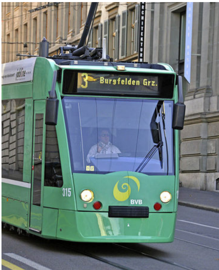
Derzeit fährt der 3er nur bis zur Landesgrenze.

Über die deutsche Grenze rollt die Tram schon länger. Ab Ende 2017 soll auch Frankreich wieder ans Basler Netz angeschlossen sein.