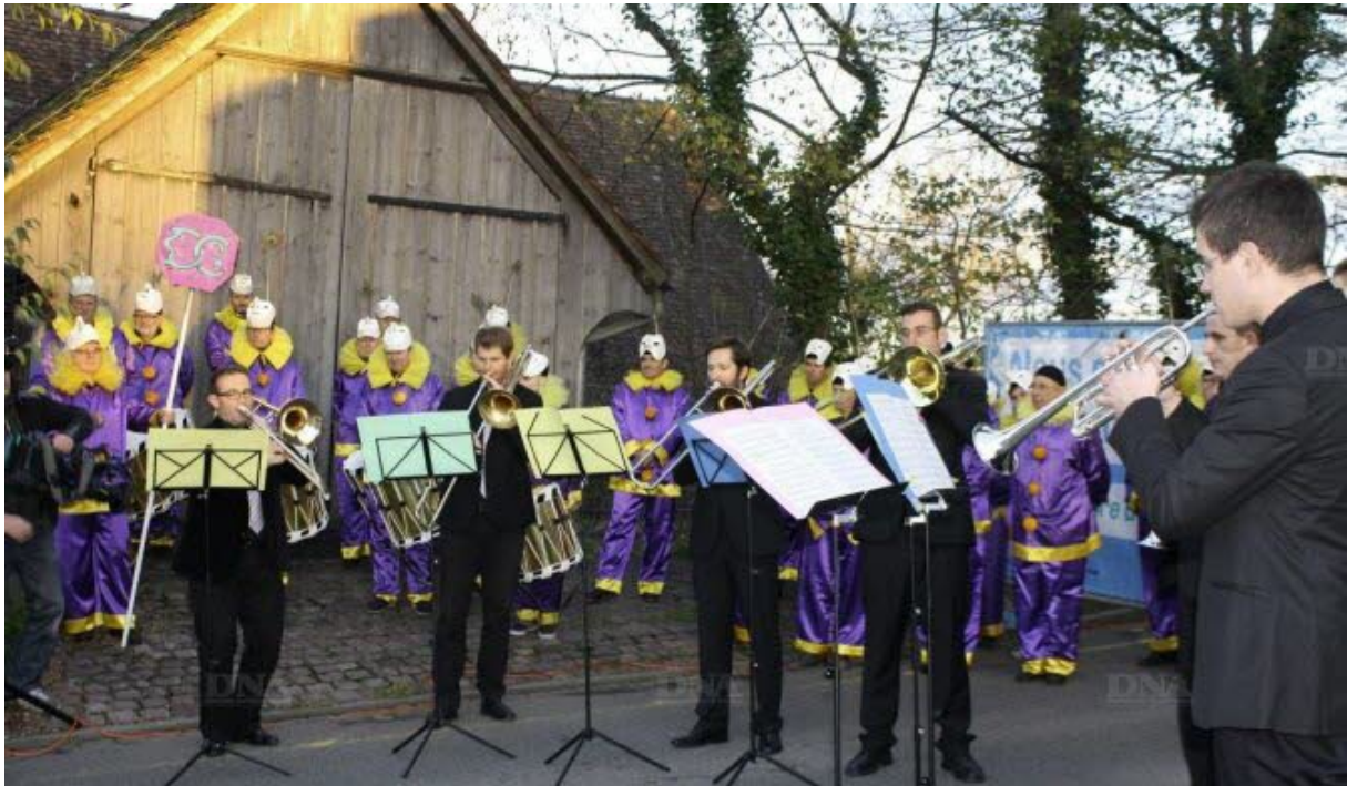
Une clique bâloise et des cuivres alsaciens pour symboliser le mélange des cultures.

La douane de Bourgfelden, entre Saint-Louis et Bâle, a vibré aux sons de deux formations musicales, hier après-midi : ceux de la clique traditionnelle bâloise du Dup Club, en ouverture, et ceux du Grand orchestre de cuivres d'Alsace, en clôture.