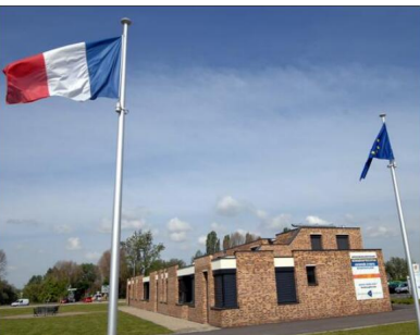
Les locaux d'Infobest sont situés juste avant le pont du Palmrain, à la frontière franco-allemande.