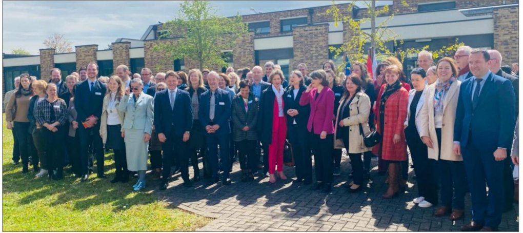
Infobest Palmrain, instance trinationale de conseils transfrontaliers à Village-Neuf, a fêté ses 30 ans fin avril.

Dernièrement, aux questions habituelles traitant des impôts, de la sécurité sociale et autres prestations familiales, sont venues se rajouter celles liées au Covid et notamment au télétravail. De suite, les chargés de mission sont passés à l'acte, se sont appropriés les législations mises en place dans chacun