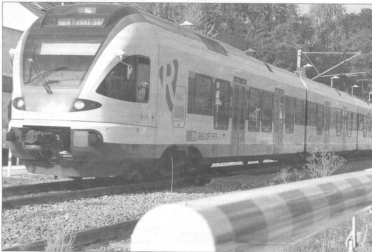
Dauerthema Nahverkehr: Wann kommt der Tarifverbund?

Trinationale Schwerpunkte für das Jahr 2008: Verkehr, Arbeitsmarkt, Gesundheit und Kommunikation sind im kommenden Jahr die großen Themen