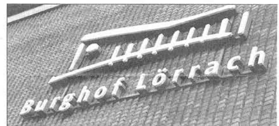
Ein Lörracher Markenzeichen: der Burghof