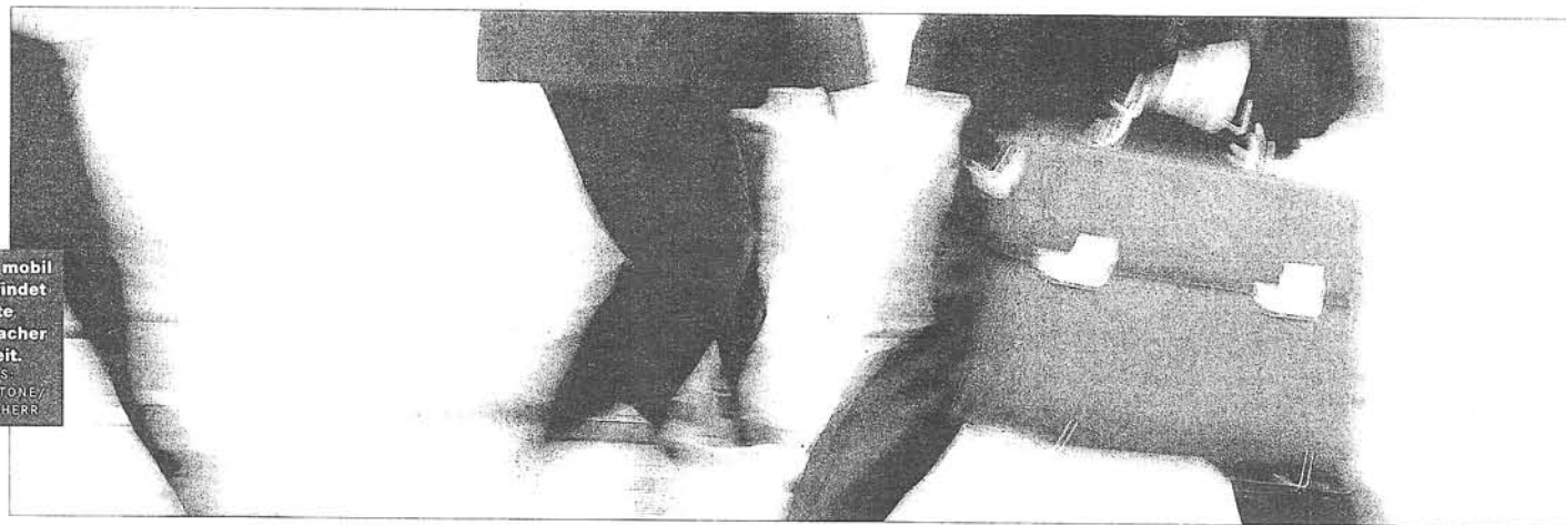
Wer mobil ist, findet heute einfacher Arbeit.

Deutschland die Angst vor einem Brain drain um, dem Abwandern der besten Köpfe. Denn vor allem Fachkräfte zieht es über die Grenze – und gerade die fehlen den deutschen Unternehmen.