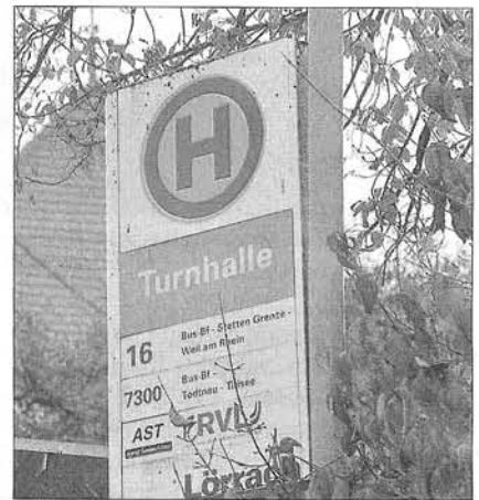
Die Linie 55 pendelt zwischen Kandern und dem Claraplatz (kleines Foto oben), der 16er fährt von Lörrach-Hauingen durch Riehen und Weil am Rhein bis Basel-Kleinhüningen.