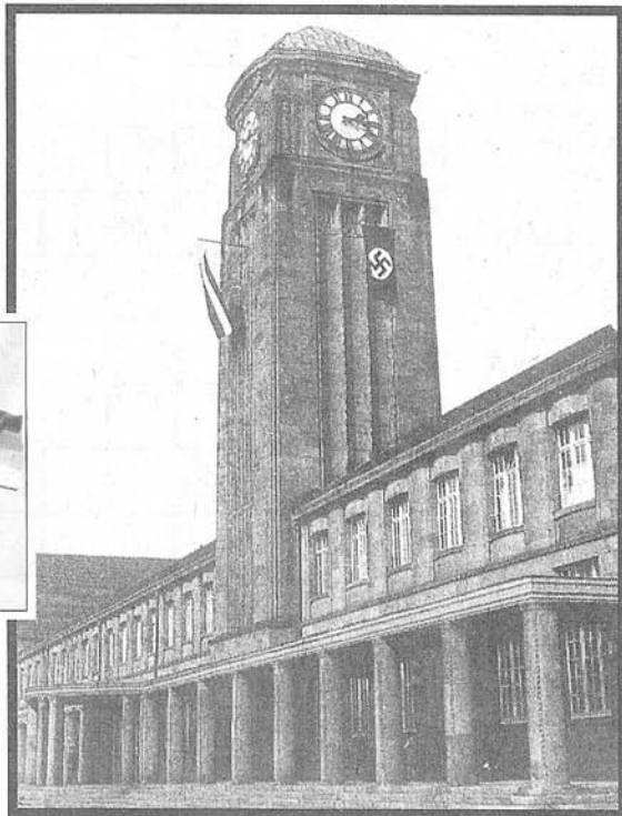
Turm mit Hakenkreuz: Badischer Bahnhof 1938

des Gedankens war, sondern Werbung. Anders als bei Christo hoffe ich, dass die Hüllen schnell fallen – und der Turm bald wieder so dasteht, wie ihn der Schweizer Architekt Karl Moser gebaut hat.