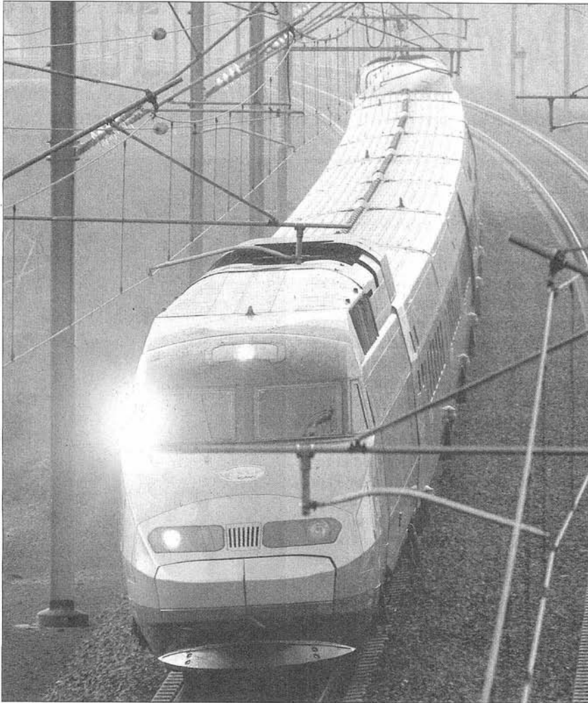
Frankreichs TGV soll auch nach Freiburg fahren.