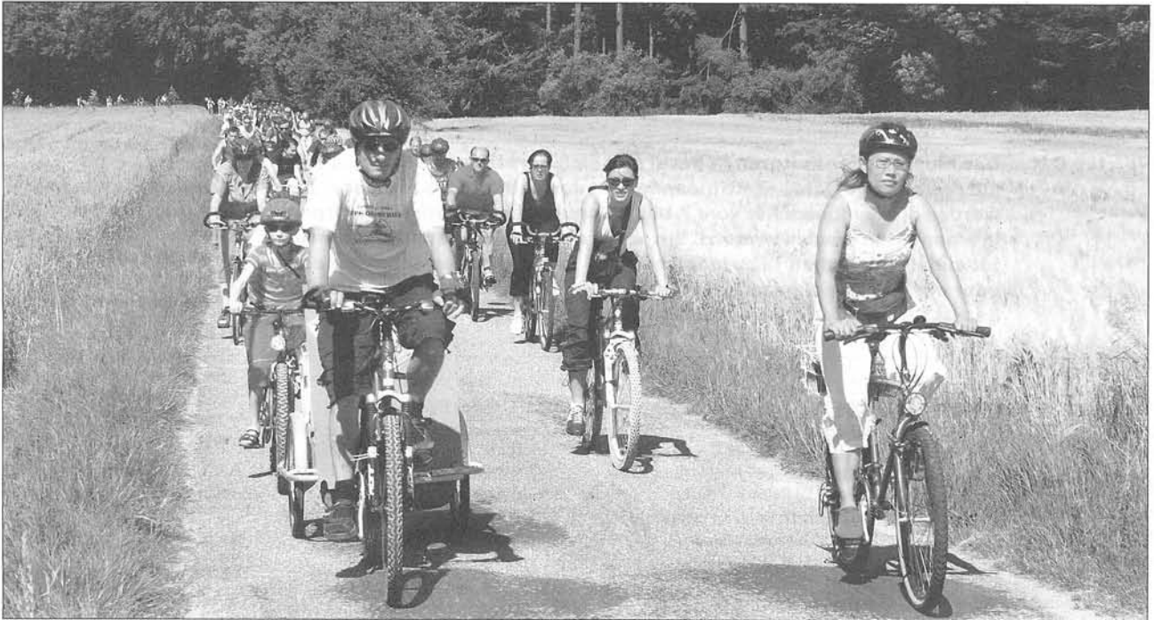
Frische Luft ohne Autoabgase können die Teilnehmer des Slow-ups genießen.