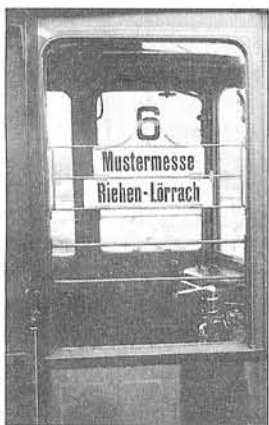
Ein Stück Geschichte.

S-Bahn-Angebots „komplett erledigt“. Immer noch aktuell klingt dagegen die Ansprache des Gemeindepräsidenten Otto Wenk bei der Eröffnungsfeier von 1908. Er appellierte an die „mächtige Stadt Basel“, sich fürsorglich zu zeigen „und den unbemittelten und weniger gut situierten Klassen den Besuch dieser gesunden und herrlichen Landschaft an einem Sonntag durch ermäßigte Preise erleichtern könnte.“ Gemeint war die noch immer gute Luft von Riehen.