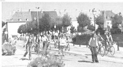
L'Office de Tourisme du Pays de St-Louis/Huningue participe à de nombreux événements et animations culturels et festifs de la région comme le « Slow up ».