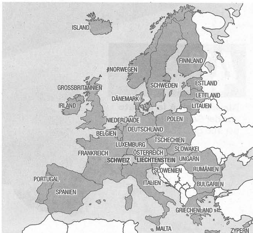
Vereint. Ab dem 12. Dezember gehören 31 Länder zum Dubliner Asylraum. Neu dazu stossen die Schweiz und Liechtenstein. Grafik BaZ/reh