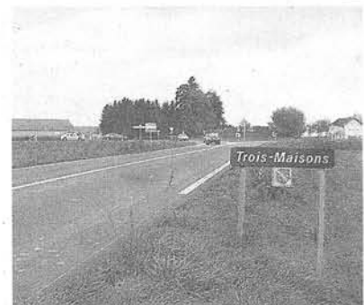
Abbiegen. Hunkelers Haus liegt hinter Trois-Maisons im Sundgau.