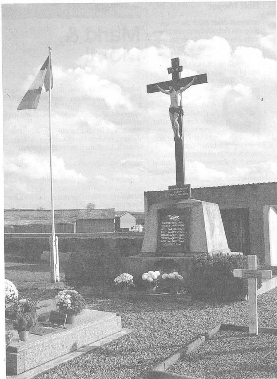
Ballersdorf. Das Denkmal auf dem Friedhof erinnert an die jungen Elsässer, die die Nazis im Struthof erschossen haben. Ihre Flucht in die Schweiz war gescheitert.

In den sieben Krimis von Hansjörg Schneider spielt das Dreiland eine wichtige Rolle