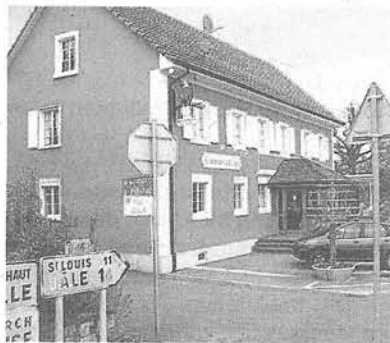
«Aigle». In Folgensbourg geht Hunkeler mit Freundin Hedwig essen.

fährt er auch nach Südbaden wie nach Todtnau oder ins Hotel Römerbad in Badenweiler. Im letzten Krimi «Hunkeler und die goldene Hand», der vor allem in Rheinfelden spielt, geht es auch auf die andere Rheinseite nach Dossenbach, Nordschwaben oder Franken.