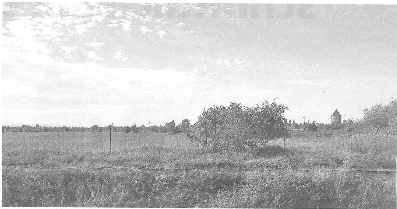
70 Hektar. Noch ist das Gelände in der Nähe des Flughafens unbebaut.

planten Einkaufszentrums. «Laut Investor Unibail werden an einem Samstag 1500 Autos die Stunde erwartet. Wenn man das hochrechnet und nur von 1000 ausgeht, kommt man auf vier Millionen Autos im Jahr.» Deshalb fordert Saint-Louis eine Verkehrsstudie, die Igersheim jetzt zugesagt habe.