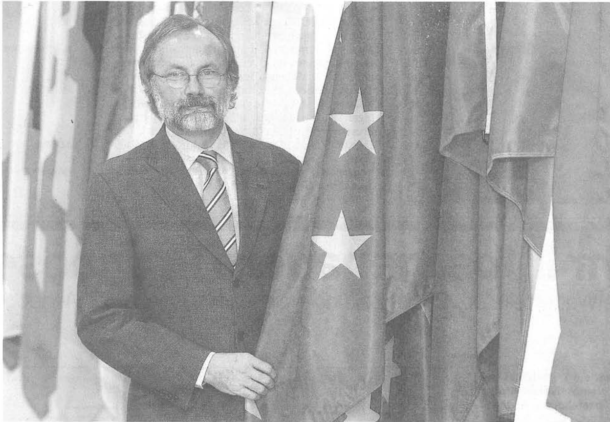
Diplomatisches Lob. EU-Botschafter Michael Reiterer rühmt die Schweizer für ihre demokratische Reife.

Die EU werde der Schweiz keine bessere Freizügigkeitsvariante präsentieren, sagt EU-Botschafter Reiterer