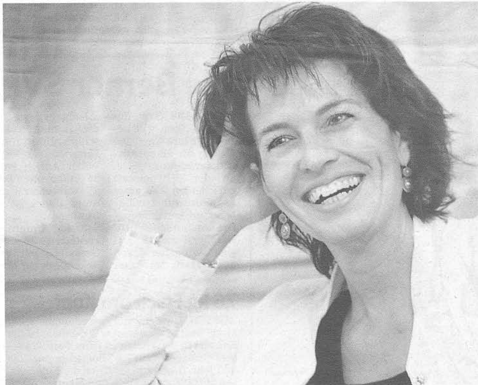
«Die Deutschen können sich besser ausdrücken und sind «pushy».»

portun. Es ist richtig, dass die deutsche Zuwanderung überdurchschnittlich ist. Wir haben zum Beispiel in vielen Spitälern ein Drittel Zugewanderte, weil wir die Nachfrage nicht selber decken können. Ich verstehe, wenn sich die Mitarbeiter in gewissen Branchen fragen, ob es schon wieder einen Deutschen braucht. Gerade an den Universitäten gibt es zu-